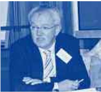
Werner Theisen Ministerium für Gesundheit und Soziales Sachsen-Anhalt, Magdeburg