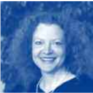
Margarete Bause MdL Vorsitzende der Fraktion „Bündnis 90/ Die Grünen“ im Bayerischen Landtag