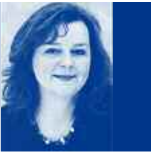
Jana Frädlich Kinderbeauftragte der Landeshauptstadt München